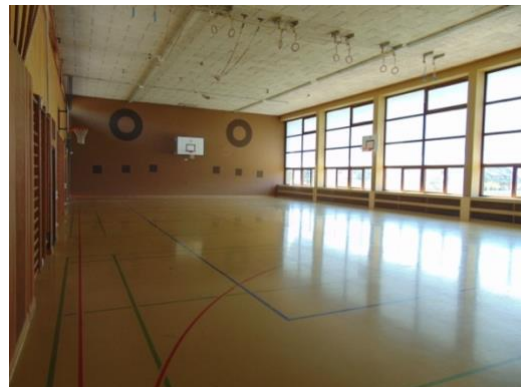
Sporthalle Gurnigel – Im Erdgeschoss befindet sich die Einfachsporthalle, im Untergeschoss das Lehrschwimmbecken.