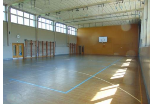
Sporthalle Thalgut mit dem Anbau Werkräume (linkes Bild, rechts) innen und aussen. (Bilder: Gemeinde Belp)

Die Gestaltung des Stundenplans wird dadurch erschwert. Bei der Stundenplanung sind ohnehin zahlreiche Parameter zu berücksichtigen (z. B. Verfügbarkeit von Sporthallen und Fachräumen, Blockzeiten, Verschiebungen). Damit im Rahmen der Stundenplanung die nötigen Sportlektionen eingeplant werden können, braucht es zusätzlichen Raum. Basierend auf der hier dargelegten Situation sieht das Raumprogramm für die Mühlematt für die Zukunft deshalb eine neue Dreifachturnhalle vor – als Ersatz für die Sporthallen Gurnigel, Thalgut und das Lehrschwimmbecken. Eine Dreifachsporthalle lässt sich unterteilen. Die Halle lässt sich demnach als eine einzige grosse Halle, als zwei Hallen unterschiedlicher Grösse oder als drei Hallen nutzen. Mit einer Doppelsporthalle könnten die Stundenpläne nicht mehr erstellt werden.