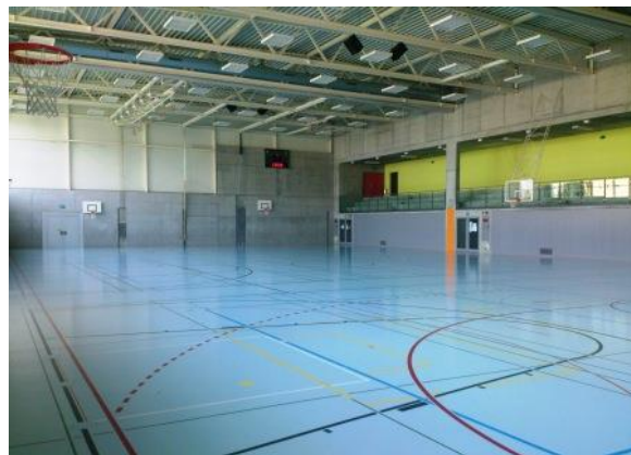
Die Sporthalle Neumatt aussen und innen. (Bilder: Daniel Widmer, Gemeinde Belp)

Eigentlich verfügt die Neumatt über eine weitere Sporthalle. In dieser Halle wurden im Frühling 2017 massive Feuchtigkeitsschäden festgestellt. Der Hallenboden musste komplett entfernt werden. Da zu diesem Zeitpunkt kein akuter Handlungsbedarf vorlag, wurde eine Sanierung der Turnhalle zurückgestellt. Derzeit wird die Halle durch den «Boule Club Belp» und «Karate Belp» zwischengenutzt. Der Vertrag wurde am 1. Juni 2020 auf 10 Jahre abgeschlossen. Eine Kündigung per Ende Mai 2027 ist möglich.