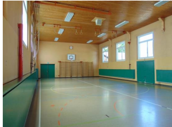
Die Dorfturnhalle aussen und innen.