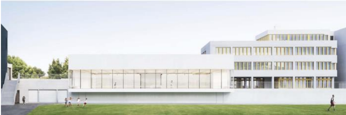
Das Siegerprojekt «Neptun» in der Schulanlage Neumatt. (Bild: Enrico Garbin 2 Architetti, Matteo Rossetti)

Aus Kostengründen – circa CHF 9 Mio. – wurde der Neubau bisher nicht realisiert. Beim Wegfall des Lehrschwimmbeckens ist der Unterricht in die Sporthallen der anderen Schulstandorte zu verlagern. Die Vorgabe des Lehrplans 21 des Kantons Bern 5 sieht zwar Schwimmen und Sicherheit im Wasser vor, doch gelten die Angaben nur für Schulen mit Zugang zur entsprechenden Infrastruktur. Den Wasser-Sicherheits-Check (WSC) müssen alle Schülerinnen und Schüler bis Ende des 4. Schuljahrs absolvieren. Der entsprechende Unterricht kann auch im Freibad erfolgen oder in einer Drittgemeinde stattfinden.